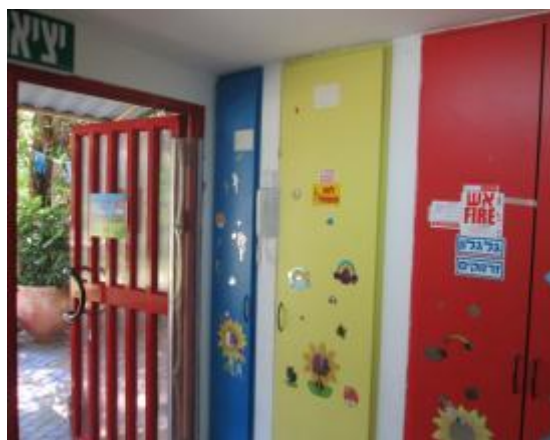
תמונה 2 : חצר הפעילות